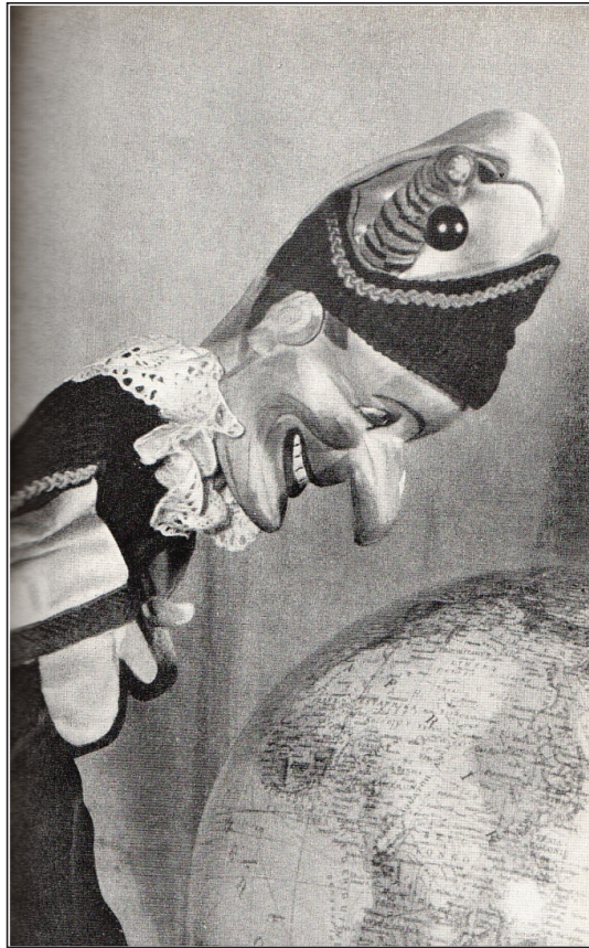
Abbildung 4: Jacob, 1964: 160. „Kasper plant eine Weltreise“ (Jacob, 1964: 343). Fotograf unbekannt Die Bildvorlage stammt laut Abbildungsverzeichnis aus dem Archiv des Autors.

Die Ursache der Peinlichkeit, also Hatüs fremdbestimmte Gestaltung des semitisch Bösen und die Angst vor ihm, manifestieren sich in einem Kasperl, dessen Hanswurst-Tradition zweifellos monströse und groteske Überzeichnungen mit Diskriminierungspotential bereithält, und zwar sowohl was die Schauspielerfigurinen als auch die Puppen-Stereotypen männlicher erwachsener oder infantilierter Kaspervarianten angeht. Nachvollziehbare Peinlichkeits- und Schuldgefühle führen in Hettches Diegese jedoch dazu, dass nicht nur die rassistischen Kodierungen des NS-Regimes und ihre biographischen Folgen, sondern auch deren a priori unbelasteten physischen (oder bildlichen) Substrate selbst als deren vermeintliche Ursachen—als Trigger: Nasen, Lippen, Gesichter—zum Verschwinden gebracht werden und mit ihnen auch ein in der NS-Zeit alles andere als eindeutig semantisiertes Kasperle-Typus. Max Jacob weist in seinen Lebenserinnerungen mit Blick auf seinen Hohnsteiner Kasperl-Typus darauf hin: