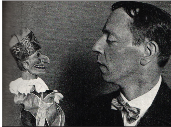
Abbildung 2: Jacob, 1964: 80. „Max Jacob mit seinem Kasper 1930“ (Jacob, 1964: 343).

Die pygmalionisch grundierte Ikonographie der fotografischen Selbstinszenierung von Puppenspielern mit ihrer selbst geschaffenen Kasperle-Puppe als Alter-Ego bedient sich dieser Engführung.